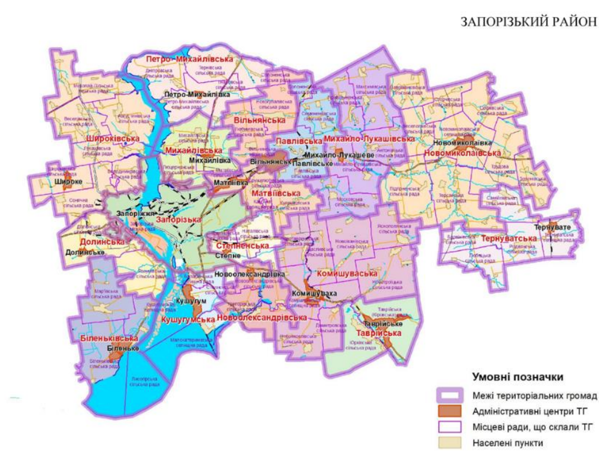
Рис. 3. Громади Запорізького району. 5

Посилання на електронні ресурси цих громад можна знайти на сайті Запорізької районної державної адміністрації. 4