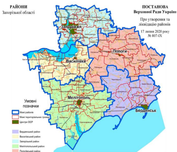
Рис. 1. Територія Запорізької області до окупації. 2

До повномасштабного вторгнення в області було п'ять великих районів, до складу яких входили 36 сільських, 17 селищних і 14 міських територіальних громад. 1