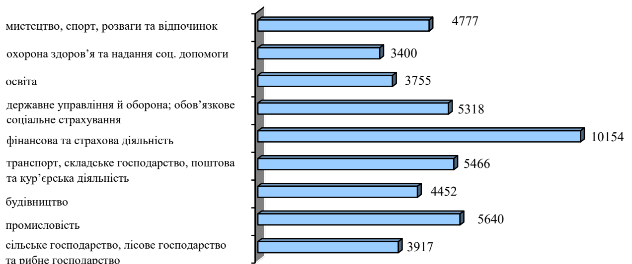
Заробітна плата за видами економічної діяльності за травень 2016 року, гривень

У травні 2016 року заробітна плата штатних працівників за видами економічної діяльності становила 4 984 грн, що на 1,8 % більше порівняно з квітнем 2016 року та на 23,3 % більше, ніж у відповідному місяці 2015 року (у промисловості заробітна плата працівників становила 5 640 грн, або 120,4 % в порівнянні з травнем 2015 року).